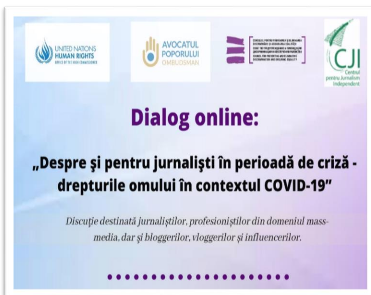
Dialog online „Despre și pentru jurnaliști în perioada de criză” Desfășurat la inițiativa Oficiului ONU pentru Drepturile Omului